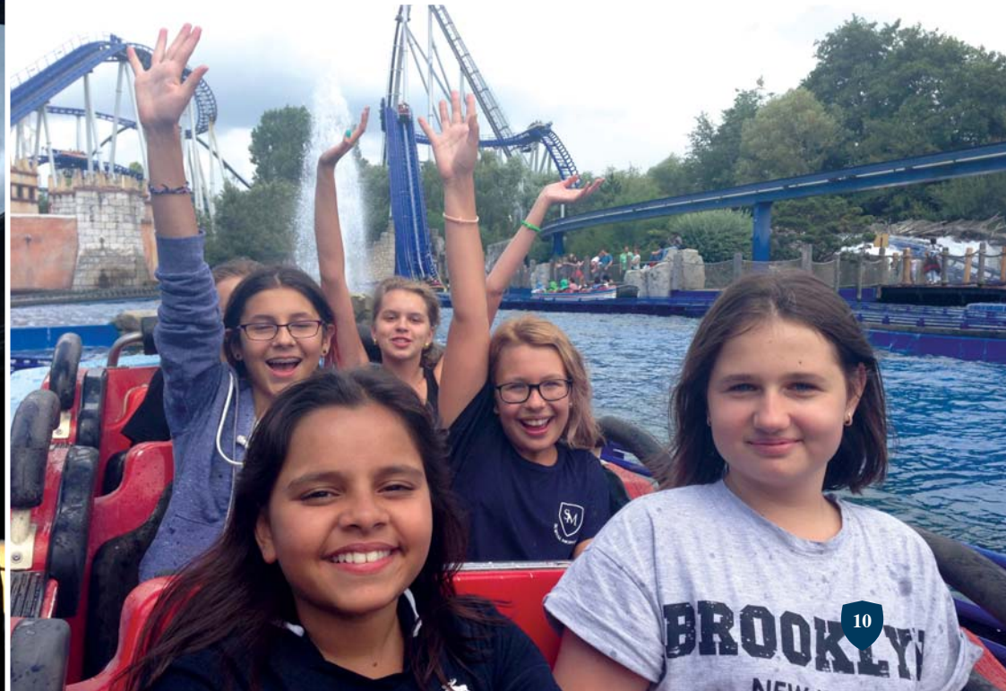
«Я прекрасно провела время в “Сюрваль Монтрё”. Я познакомилась с девочками из разных стран и обрела настоящих подруг». Ученица из США